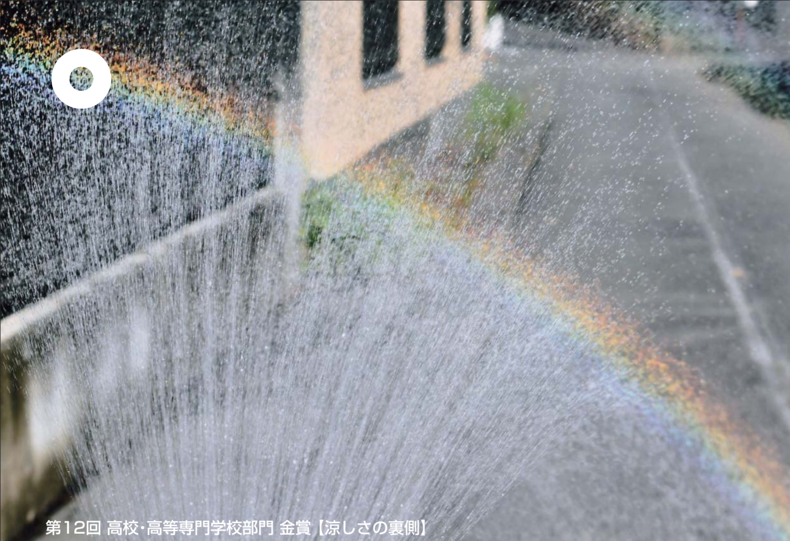
第12回 高校・高等専門学校部門 金賞【涼しさの裏側】