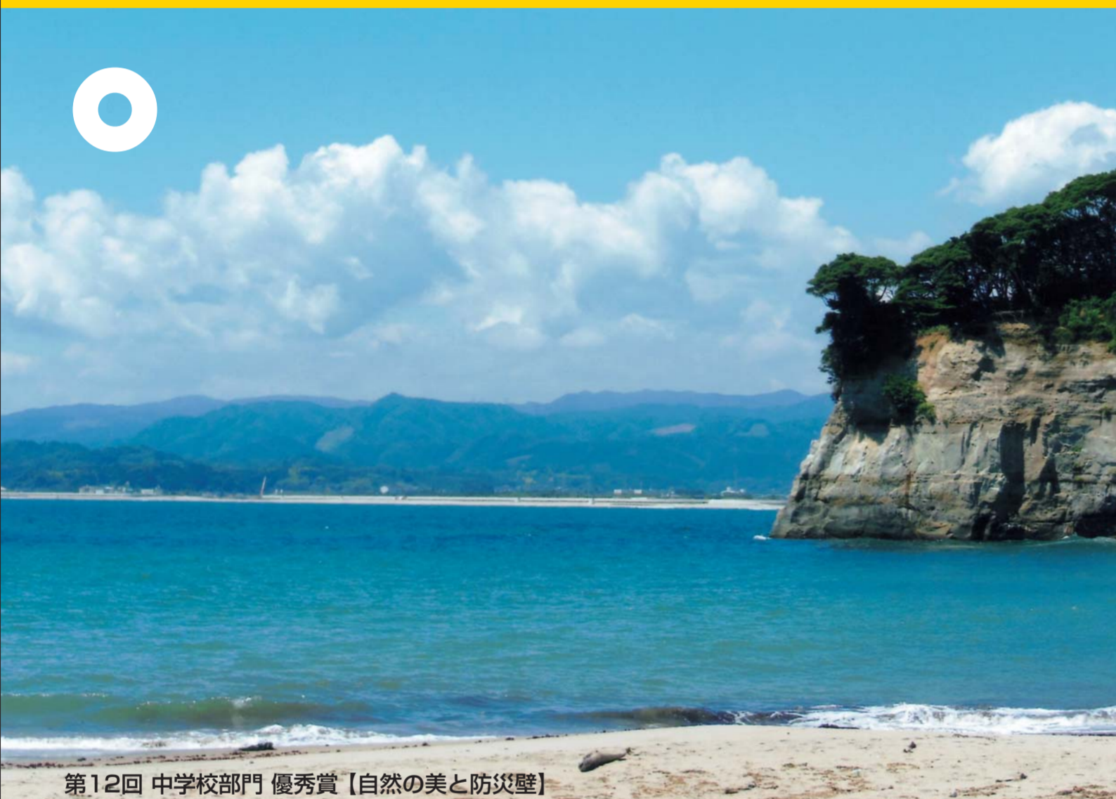
第12回 中学校部門 優秀賞【自然の美と防災壁】